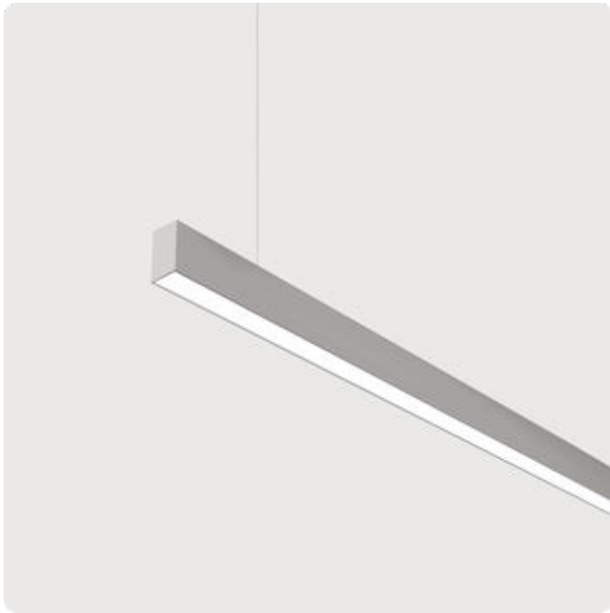
Abbildungen ggf. nur ähnlich, dienen als Orientierung.

Matric-RX. LED. Lichtlinie für Pendelmontage. Beleuchtungskörper aus hochwertigem Aluminiumprofil. Oberfläche Silver Anodised. Lichtcharakteristik: Direkt-/ indirektstrahlend. Farbtemperatur: 4000K (Cool White). Farbwiedergabeindex (Ra): >80. Microprismenoptik zur Reduktion der Leuchtdichte in Office-Bereichen. UGR<=19. Einfach schaltbar. LxBxH (rechteckig). L=1765mm. B=40mm. H=75mm. Einseil-Abhängung (Set). Pendellänge max 1500mm. Zuleitung: transparent. Baldachin: passend