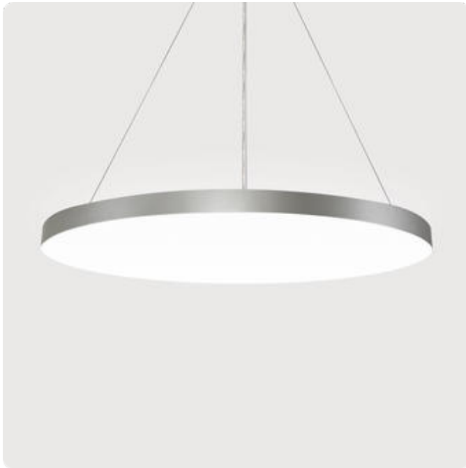
Abbildungen ggf. nur ähnlich, dienen als Orientierung.