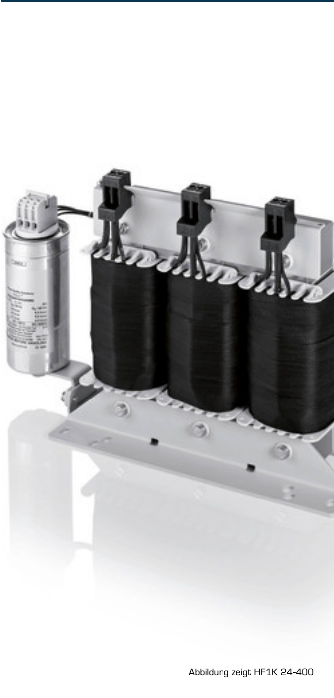
Abbildung zeigt HF1K 24-400