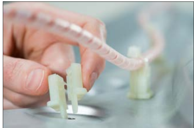
Der Keilsockel TY5 kann mit einer Vielzahl unserer Kabelbinder kombiniert werden.