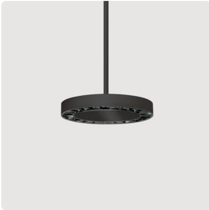
Abbildungen ggf. nur ähnlich, dienen als Orientierung.